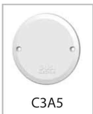
Крышка подрозетника Крепление под винтовой зажим

Материал: АБС Пластик Межвинтовое расстояние: 60 мм Габариты D = 71 мм Упаковка - 1/320/2560