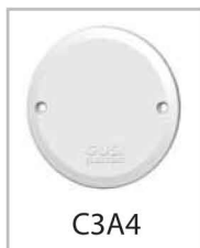
Крышка подрозетника Крепление под винтовой зажим

Материал, используемый во всех электромонтажных изделиях GUSI ELECTRIC серии STANDART, обладает свойствами достаточной прочности и негорючести.