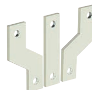
0 262 48