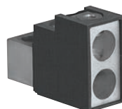
0 262 51