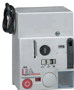
0 261 40