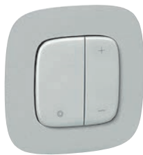
7 520 67 + 7 520 87 + 7 543 91