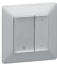
7 520 62 + 7 548 92 + 7 541 37

Механизмы Valena In'Matic поставляются с суппортами для монтажа на захватах или винтах и прозрачными крышками для защиты от загрязнений. Используются с лицевыми панелями и рамками Valena Life и Valena Allure. Упакованы в профессиональную упаковку.